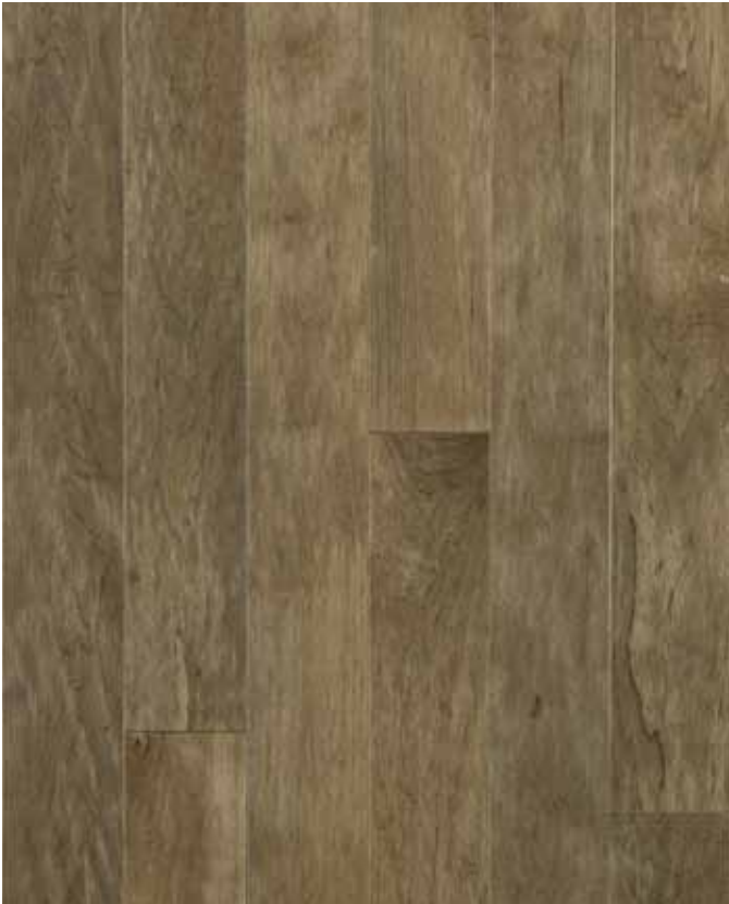
GRADE CHIC (massif et contrecollé)

NOTE : Le produit Chic contrecollé contient légèrement plus de variations de couleurs que le produit massif.