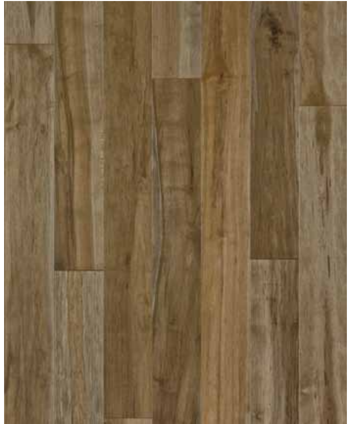
GRADE CHARME (massif et contrecollé)

NOTE : Le produit Chic contrecollé contient légèrement plus de variations de couleurs que le produit massif.